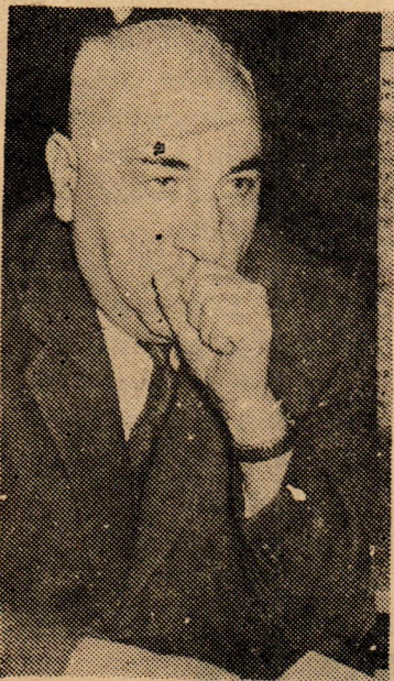
BAŞKAN CEMAL GÜRSEL Başkalari var, paşam...

Cumhurbaşkanı Gürsel, Anayasa'nın ve diğer kanunların kendisine tanıdığı «af» yetkisini kullanarak bir kısım Yassıada mahkûmlarını serbest bıraktı. Yassıada mahkûmlarının salıverilmelerinin sebebi (Devamı 4 de)